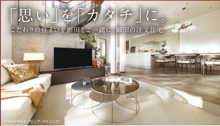
グランリザルト リビング・ダイニング