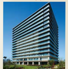
住宅棟外観(土地・建物:賃借)