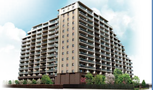
ルネ市原八幡宿 完成予想CG

いい暮らしを創る「住まいのオンリーワングループ」として、 おかげさまで分譲マンション施工戸数は69万戸に達しております。 今後も、お客様に満足していただけるようなマンション創りに取り組んでまいります。 新築分譲戸建 も取り扱っております。